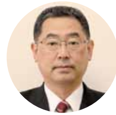
お話を伺った辻社長