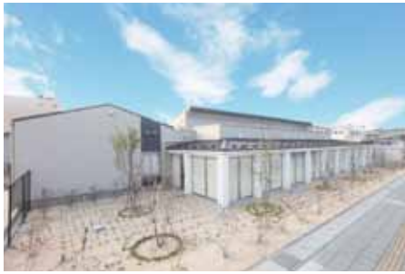
▲同社が新築工事を行った介護老人保健施設「ケアセンターささゆり」

問い合わせ：甲賀市工業会事務局(商工政策課) ☎65-0709 / ☎63-4087